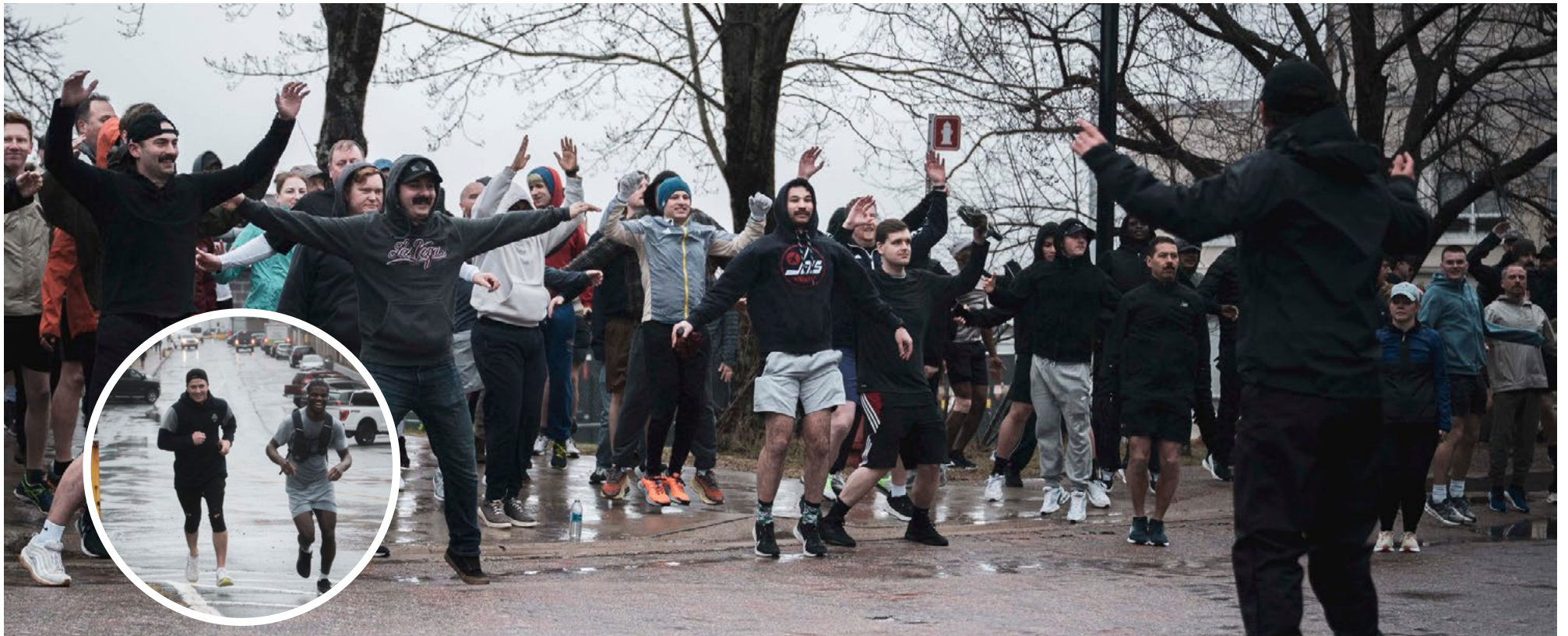
La première course/marche de la flotte de 2026 a eu lieu le 15 avril.