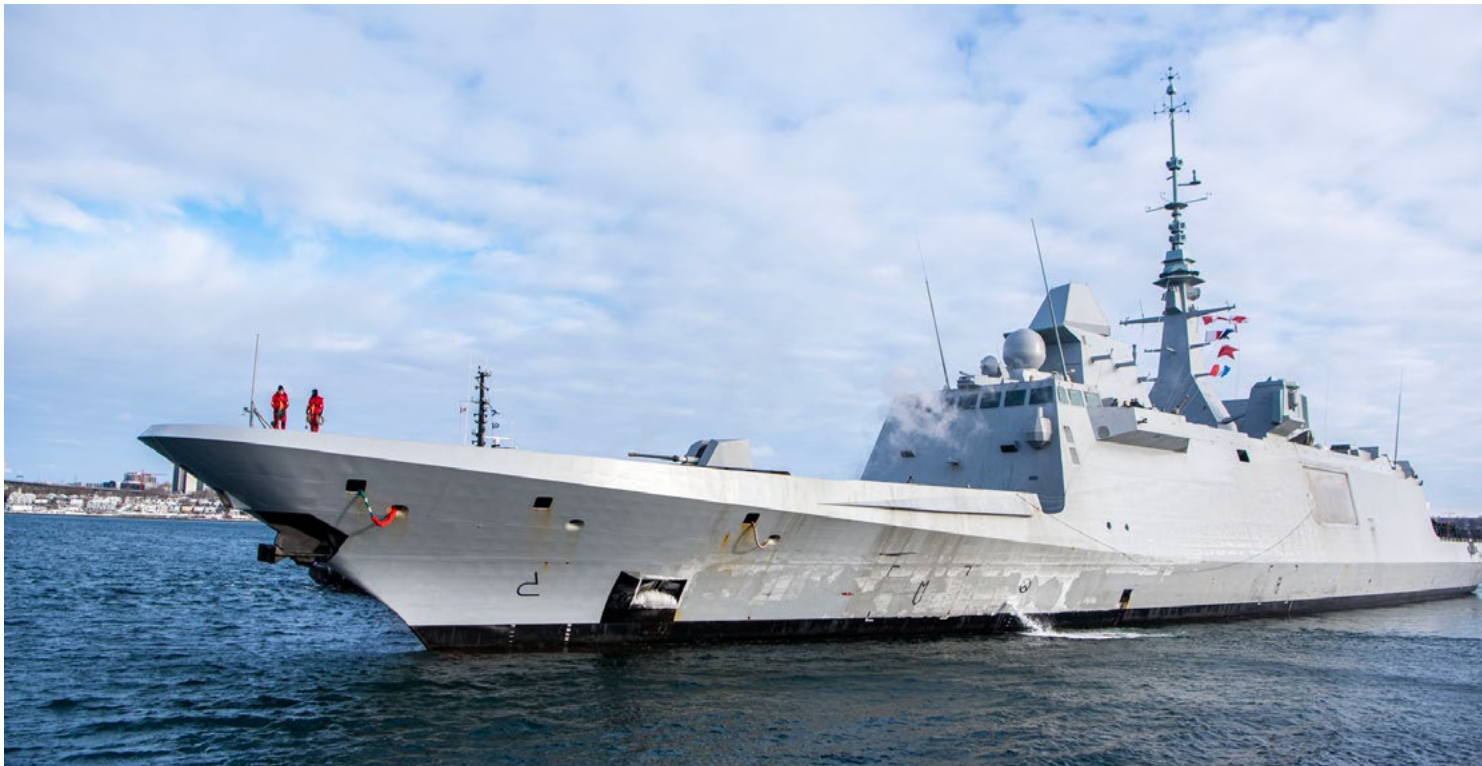
La frégate de classe Aquitaine de la Marine nationale française, le FS Bretagne (D655), arrivant à Halifax, en Nouvelle-Écosse, le 9 février.