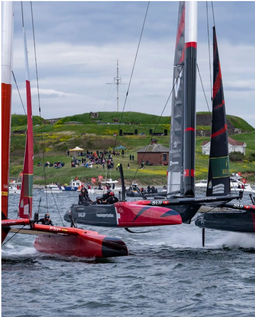
L'île Georges offre l'un des meilleurs points de vue pour assister aux courses Sail GP dans le port d'Halifax en juin.