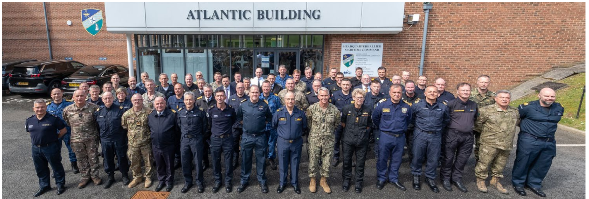
Des responsables navals de l'ensemble de l'Alliance se sont récemment réunis pour une conférence de trois jours à Northwood, au Royaume-Uni.