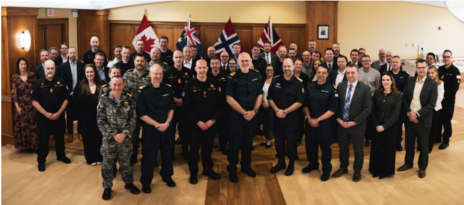
Photo de groupe des participants à la 16 e réunion du Groupe d'utilisateurs du projet de navire de combat mondial (GCS) à la Base des Forces canadiennes Halifax.