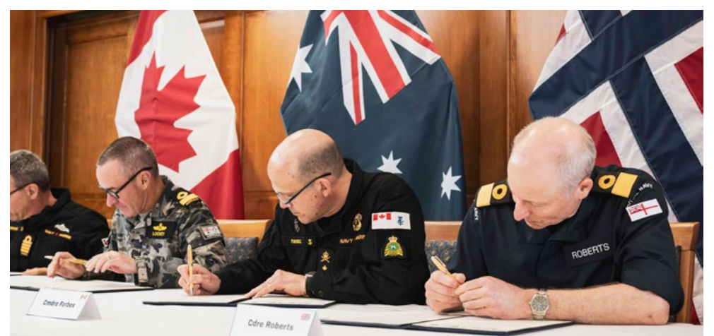
Des documents ont été signés pour accueillir officiellement la Norvège au sein du Groupe d'utilisateurs du GCS, rejoignant ainsi les membres existants que sont le Canada, l'Australie et le Royaume-Uni.