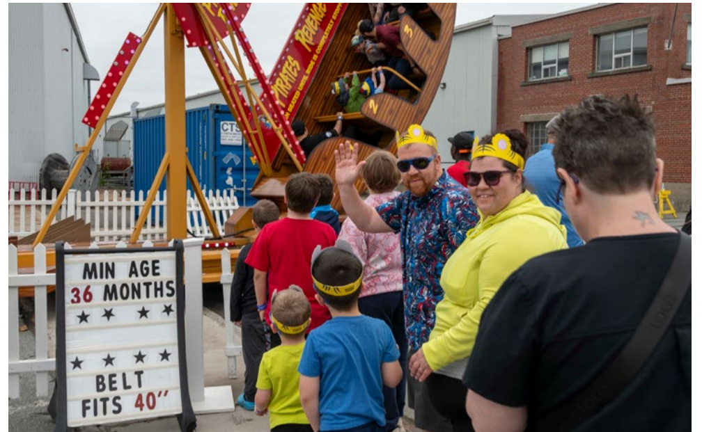
L'édition 2026 des Journées de la famille du MDN aura lieu les 12 et 13 juin.

Pour avoir une chance de gagner des billets pour le Sail GP et bien d'autres prix passionnants, n'oubliez pas de rendre visite à nos sponsors sur place et d'être à l'arsenal CSM à 14 heures les 12 et 13 juin, lorsque les tirages au sort auront lieu.