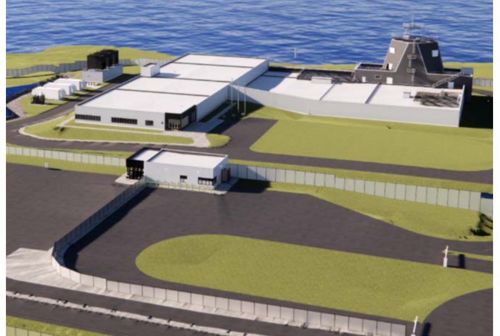
Dernière représentation de l'installation d'essai terrestre à Hartlen Point, dans l'Eastern Passage.

Le projet IET couvre environ 10 hectares et comprend le site principal, une route d'accès, des zones de sécurité au-delà de la clôture et une tranchée de contrôle des eaux pluviales. Le bâtiment