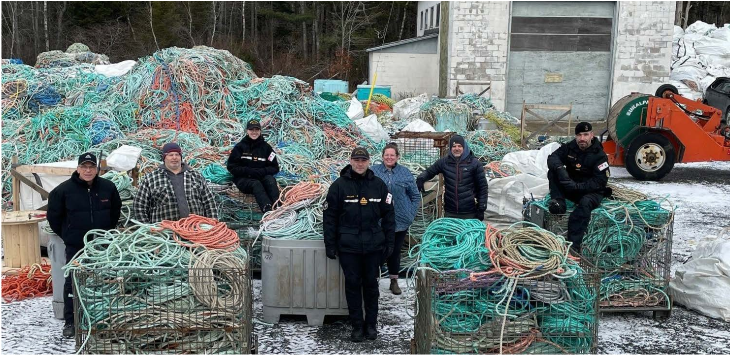
Le 12 décembre, des sous-marinières du NCSM Windsor ont fait du bénévolat au site « Happy Landing » de Coastal Action à Brooklyn, en Nouvelle-Écosse, dans le cadre de l'initiative de recyclage des cordages et des filets marins de l'organisation.