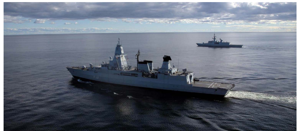
La frégate allemande Hessen lors d'une patrouille de l'OTAN en mer Baltique fin 2024.

En tant qu'une pierre angulaire de la Marine royale canadienne, les frégates de classe Halifax continuent de jouer un rôle essentiel sur les deux côtes malgré leur vieillissement, et vont rester en service jusqu'à la fin des années 2030 et l'introduction des nouveaux destroyers de la classe Fleuves et rivières.