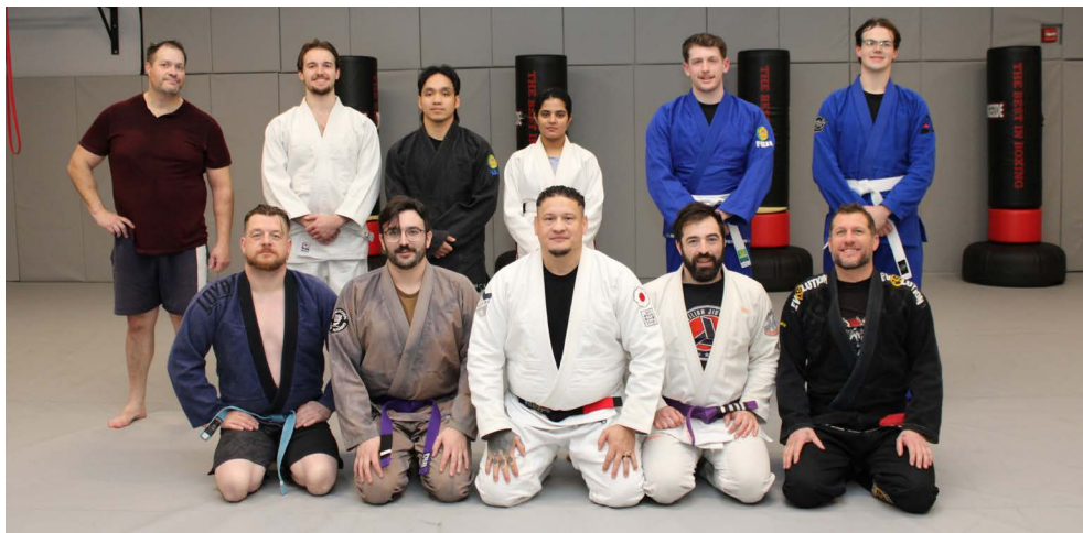
Les membres du club de combat au sol HERO de la BFC Halifax après une réunion et une séance d'entraînement le 7 janvier.