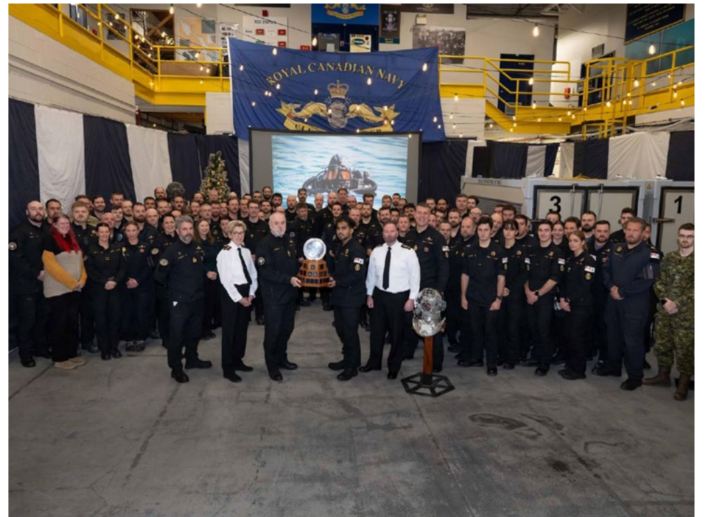
Le prix de la Coupe de l'Amiral 2025 a été remis à l'UPF(A) au quartier général de l'unité à Shearwater le 8 décembre.