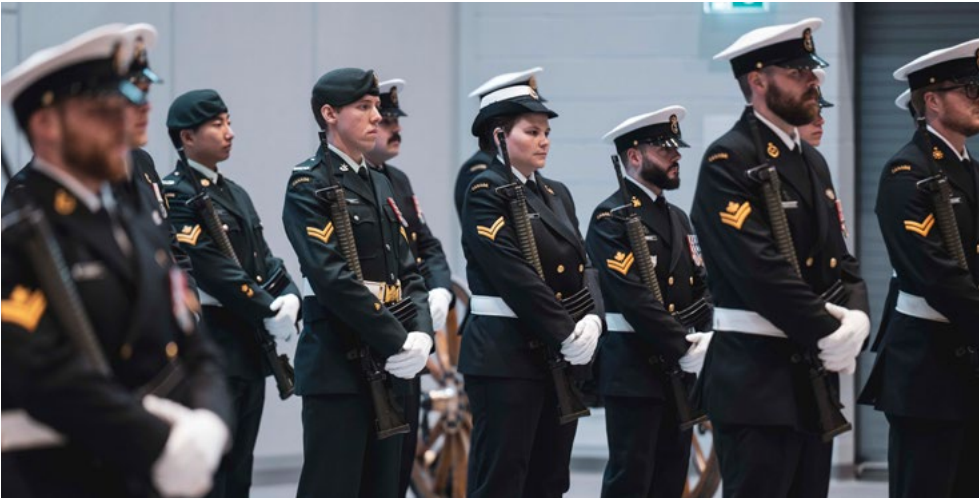
Les membres du cours 0520 de qualification élémentaire en leadership (QEL) à l'aise lors de la cérémonie de remise des diplômes le 26 novembre.

Les efforts de réduction des émissions de gaz à effet de serre au sein du CAF s'inscrivent dans le cadre d'un effort à long terme du gouvernement du Canada visant à atteindre des émissions nettes nulles d'ici 2050.