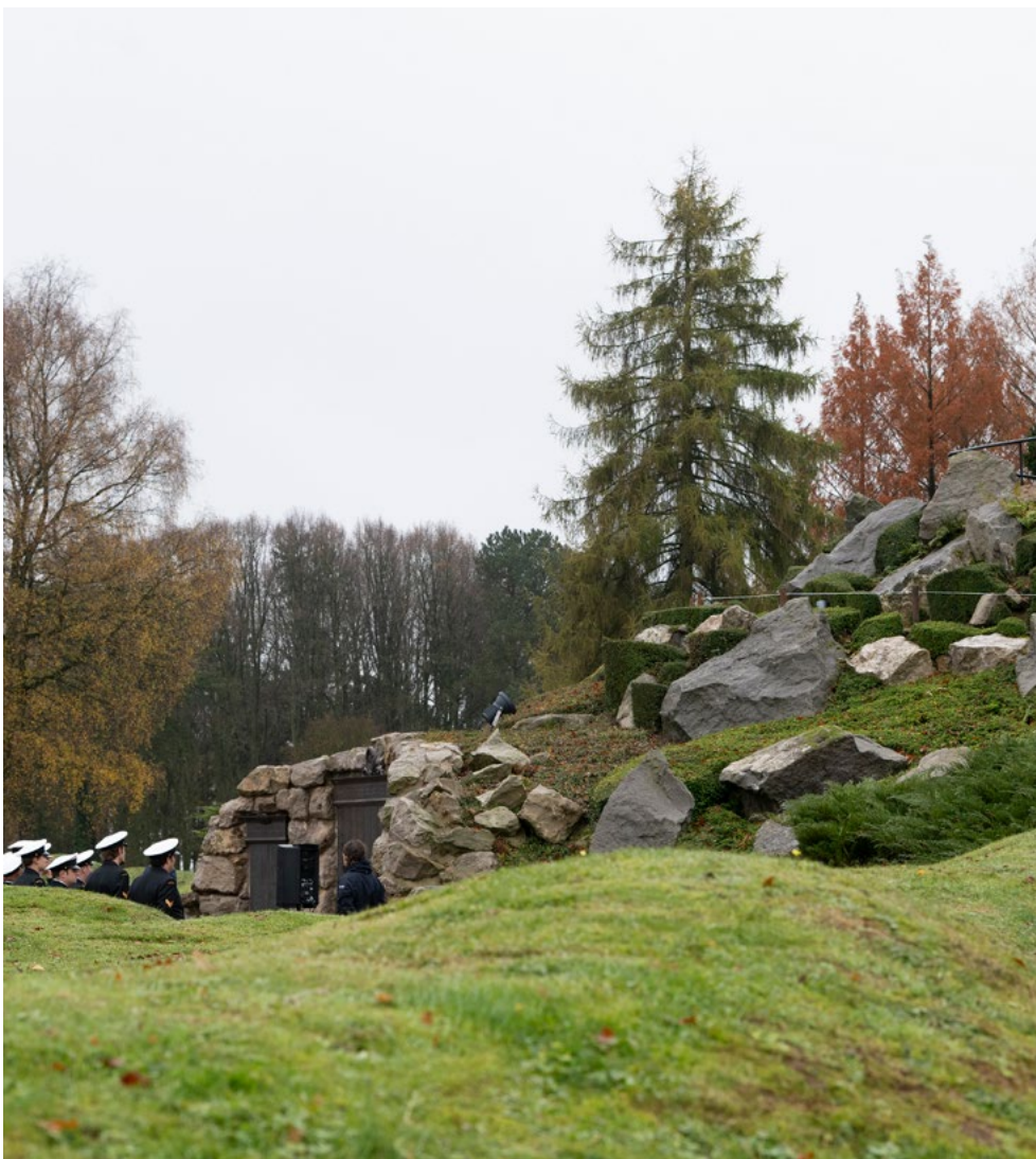
Le monument de Gallipoli, inauguré en 2021, est le sixième et dernier monument construit dans le cadre de la série du Sentier du Caribou.