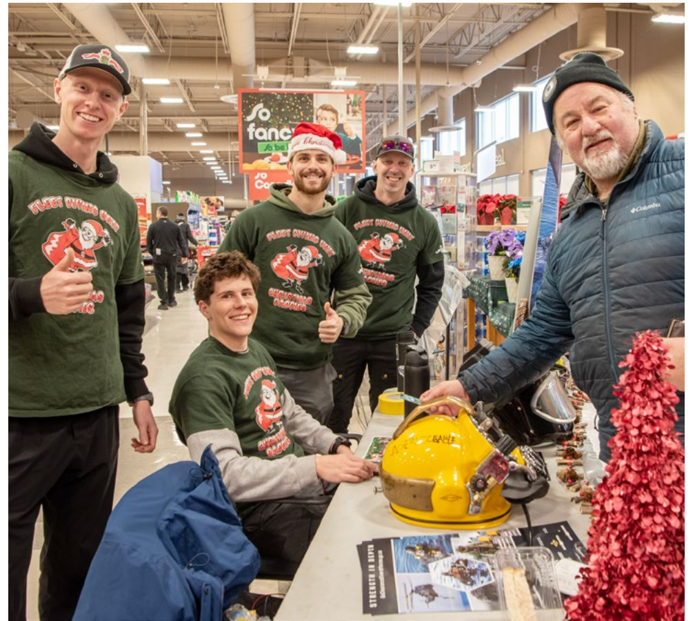
L'UPF(A) a organisé son initiative annuelle de collecte de fonds pour soutenir le téléthon Christmas Daddies d'octobre à décembre, ce qui a abouti à la remise de 33 000 dollars lors du téléthon lui-même, le 6 décembre.