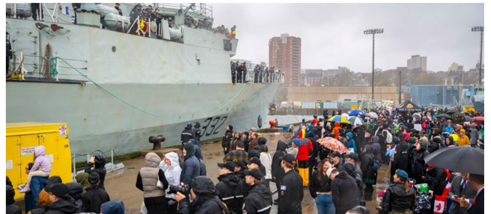
Le temps orageux n'a pas empêché une foule nombreuse de se rassembler pour accueillir l'équipage du NCSM Ville de Québec le 10 octobre.