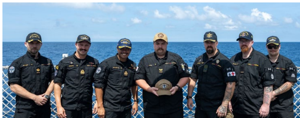
Les gagnants de l'encan silencieux des casquettes montrent leurs nouvelles casquettes. Remarque : ils ne peuvent pas la porter avec leur uniforme, c'était seulement pour la photo.

Prêt à réserver? Envoyez un courriel à l'équipe de coordination à Joseph.Abando@forces.gc.ca et à Leah.Coughlin@forces.gc.ca .