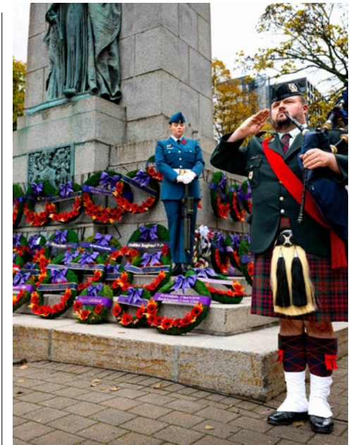
Couronnes déposées au cenotaphe de Grand Parade lors des cérémonies du jour du Souvenir 2025 à Halifax.

Au cas où vous ne l'auriez pas remarqué, les conflits et les troubles continuent de s'intensifier à travers le monde. C'est un fait que nous ne pouvons ignorer ou souhaiter faire disparaître sans y faire face avec courage et détermination. Je suis reconnaissant que le Canada continue de valoriser à la fois la paix et la préparation. Nous avons désormais le devoir moral d'enseigner aux