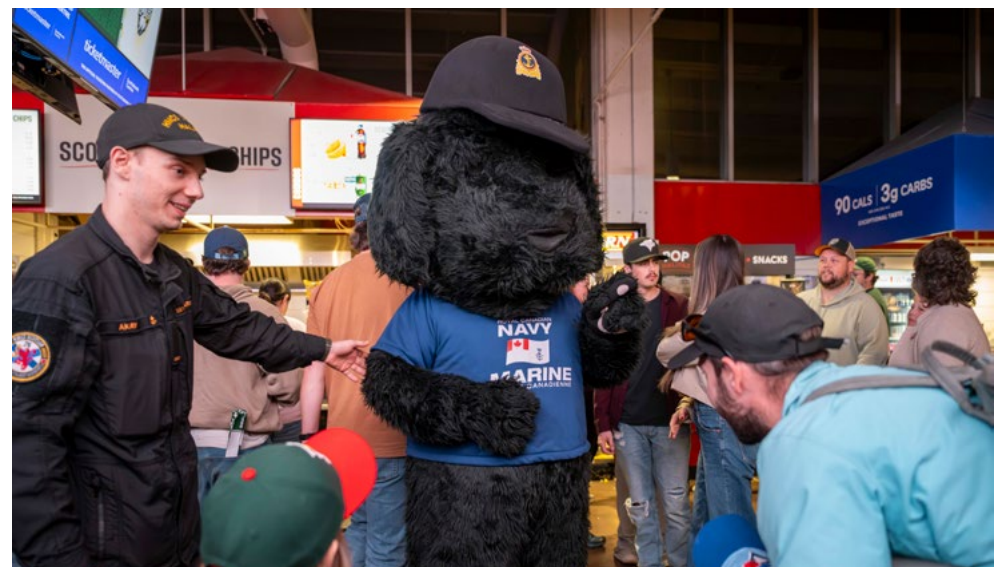
Sonar, la mascotte de la Marine royale canadienne, s'est jointe à la fête.