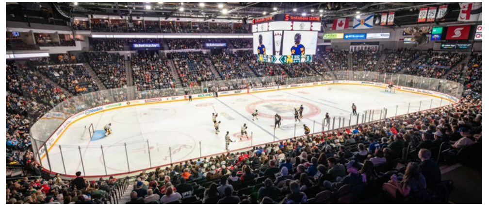
Sur la glace, les Mooseheads d'Halifax ont remporté une victoire de 5 à 3 sur les Eagles du Cap-Breton.