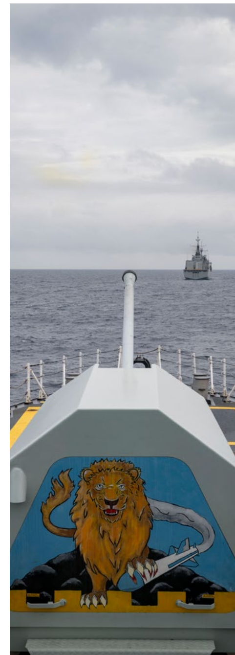
Le NCSM St. John's vu lors d'exercices de tir avec l'ITS Carlo Bergamini et l'ESPS Cantabria, près de Tarente, au large du sud de l'Italie, le 31 octobre.

La présence maritime continue de l'OTAN en Méditerranée est un symbole tangible de l'unité et de la dissuasion des Alliés, qui veille à ce que les voies maritimes vitales reliant l'Europe, l'Afrique et le Moyen-Orient restent sûres, ouvertes et sécurisées. « La Méditerranée est une ligne de vie pour la prospérité économique des nations alliées et pour la stabilité euro-atlantique », a conclu le contre-amiral Iavazzo. « La sécurité de ces eaux et la sécurité de l'Europe sont indissociables : en protégeant l'une, nous protégeons l'autre. »