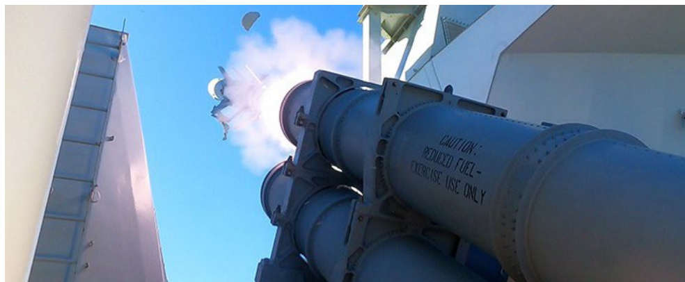
An exercise variant of the Mark II Harpoon Missile is launched from its tube aboard HMCS Ville de Québec during a live-fire exercise while deployed in the Indo-Pacific on Op Horizon.

L'exercice étant maintenant terminé, le Ville de Québec poursuit son déploiement dans l'Indo-Pacifique aux côtés du groupe d'attaque de porte-avions du Royaume-Uni dans le cadre de l'opération Horizon. Le navire a déjà parcouru plus de 25 000 milles nautiques depuis son départ d'Halifax en avril, et il en reste encore à parcourir avant son retour prévu à la fin de l'automne.