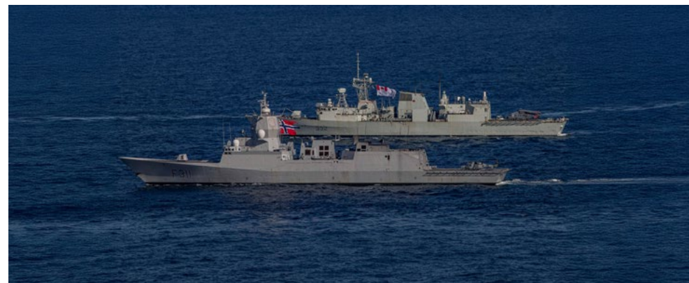
Le NCSM Ville de Québec navigue aux côtés du navire norvégien HNoMS Roald Amundsen pendant l'exercice Talisman Sabre 25 en Australie.