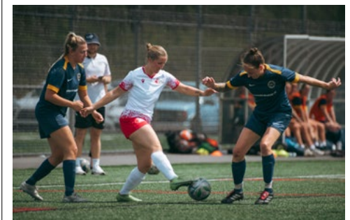
Les équipes de soccer du CISM des FAC se préparent pour les tournois internationaux prévus en 2026 et 2027.

The CAF CISM soccer teams are preparing for international tournaments scheduled in 2026 and 2027.