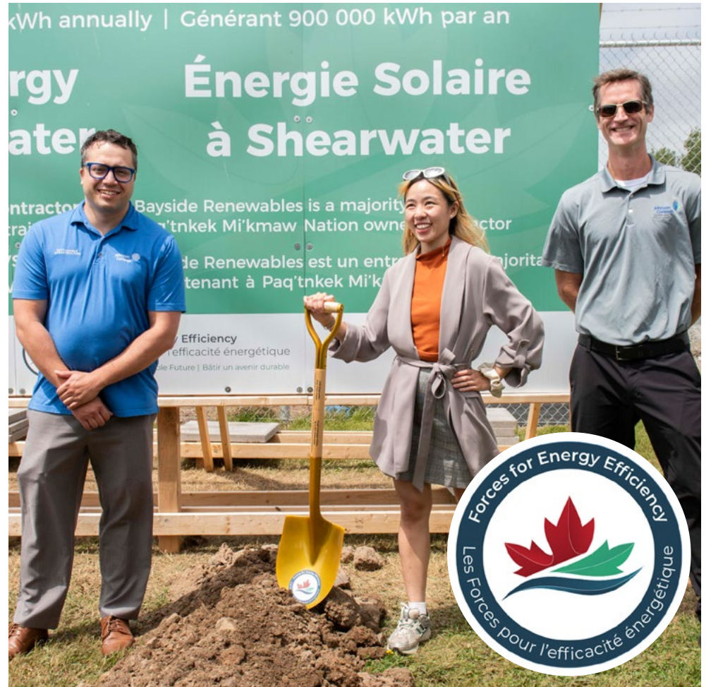
Representatives from Johnson Controls helped mark the beginning of construction on the solar project.

Les dirigeants de la BFC Halifax et de la 12e Escadre étaient présents à la cérémonie d'inauguration, aux côtés de représentants de l'Unité des opérations immobilières (Atlantique), de l'entrepreneur EPC Johnson Controls et de Construction de Défense Canada. Le contrat EPC vise une réduction annuelle de 24 % des émissions de gaz à effet de serre à la BFC Halifax et à la 12e Escadre Shearwater une fois les travaux terminés.