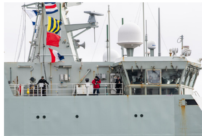
HMCS Harry DeWolf is back in its home port of Halifax following a six-week Op Caribbe deployment. The ship returned on March 22.