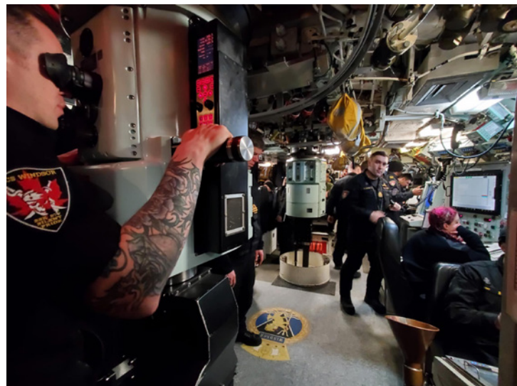
While submerged, HMCS Windsor 's crew works meticulously inside the control room to ensure navigational safety.

Once fully submerged, the crew took the time to explain the functions of their workstations and