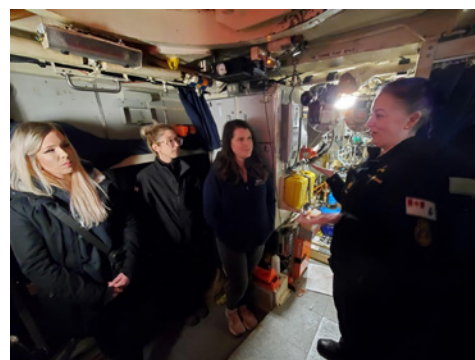
La M 2 Inglis, capitaine d'armes du NCSM Windsor, décrit la vie à bord d'un sous-marin aux membres de la famille qui ont participé à la journée de navigation.

Une fois complètement immergés, les membres de l'équipage ont pris le temps d'expliquer les fonctions de