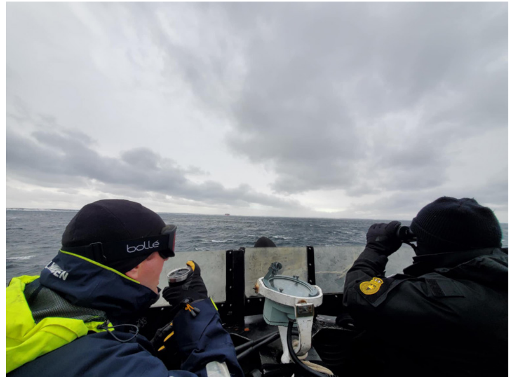
The view from the bridge of HMCS Windsor while underway on February 1.

La vue depuis la pont du NCSM Windsor en route le 1er février.