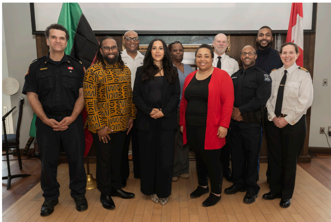
Membres du Groupe consultatif des minorités visibles de la Défense (GCMVD), pompiers de la région d'Halifax, GRC, et conférenciers principaux lors de la conférence du Mois de l'histoire des Noirs le 25 février.