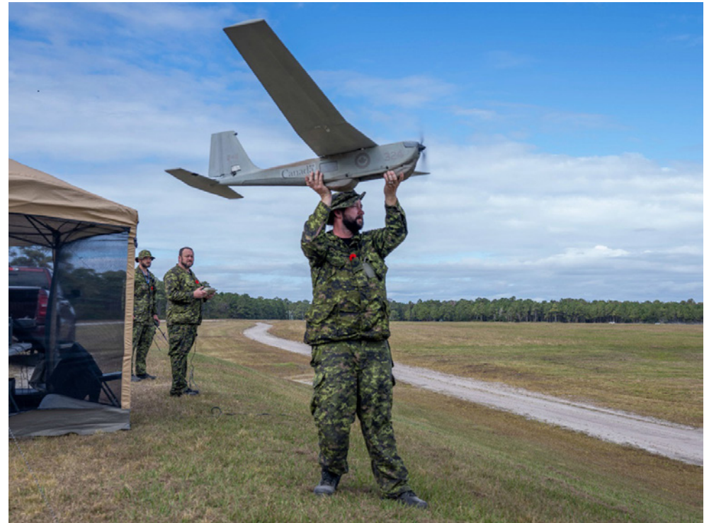
ANCU members participate in Exercise Bold Quest 2024 at Camp Lejeune, North Carolina.

By combining advanced sensors, unmanned systems, and data fusion technologies, RCN ISTAR enables superior situational awareness, improving the Navy's ability to respond to evolving threats in dynamic maritime environments. The successful