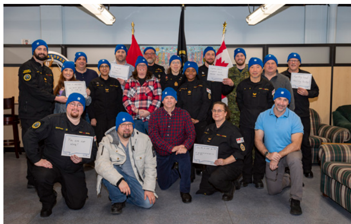
AVR ANNABELLE MARCOUX / L'AVR ANNABELLE MARCOUX

For more information on mental health resources for Defence Team members and their loved ones, visit https://tridentnewspaper.com/mental-health-resources/ .