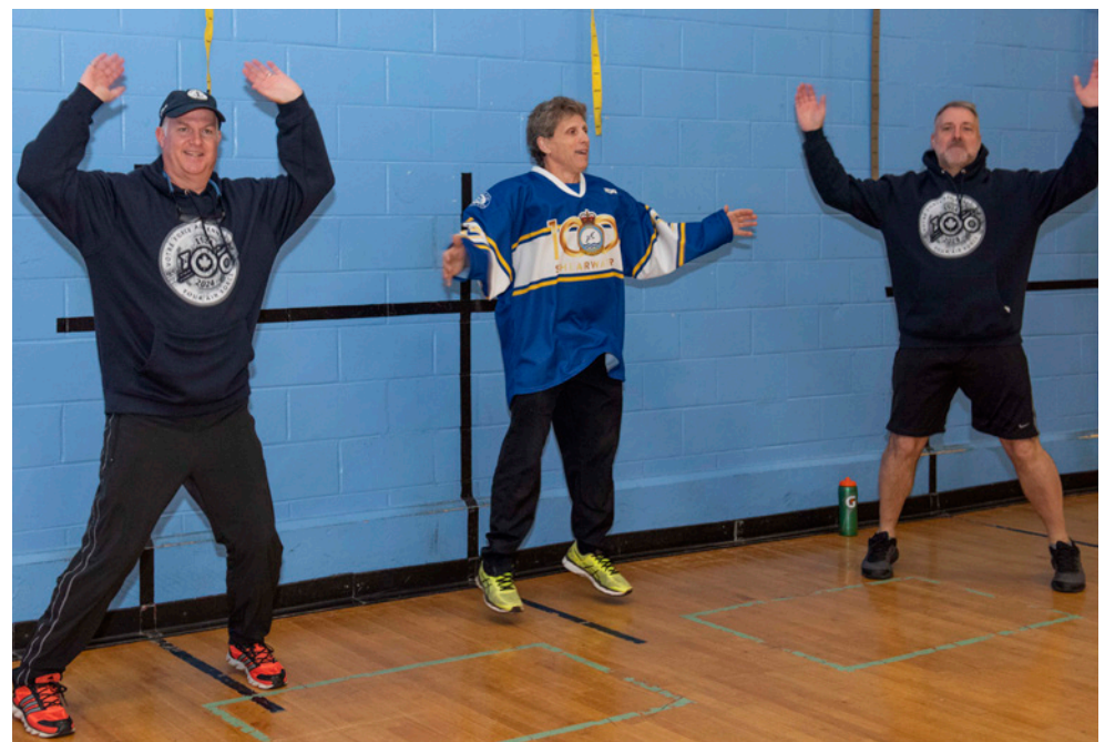
CAF Sports Day kicked off in Shearwater with a warm-up led by PSP staff and the Wing Command team.

« Pour garder notre esprit combatif, nous devons aussi prendre soin de nous-mêmes, de notre corps et nous amuser. C'est pourquoi des journées comme celle d'aujourd'hui et la participation à la Journée du sport des FAC sont très importantes », a-t-il ajouté.