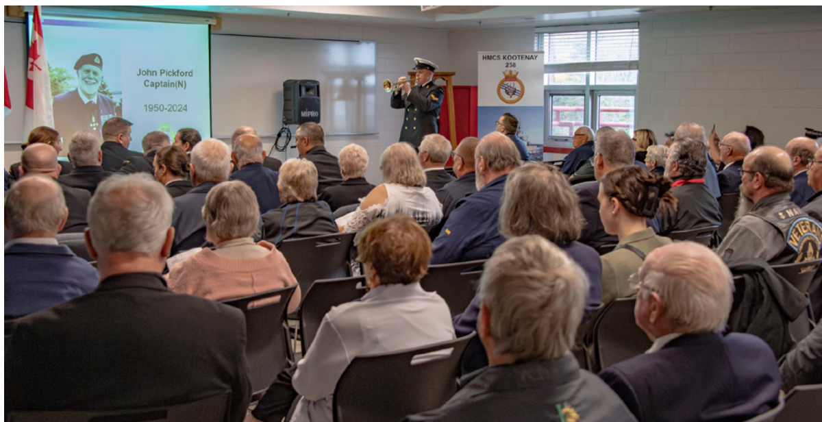
The Last Post and Reveille is played following the roll call of “ Kootenays ”, both those who died in 1969/1970, and those who passed in the last year.

La Dernière sonnerie et le Réveil sont joués après l’appel des « Kootenays », tant ceux qui sont morts en 1969/1970 que ceux qui sont décédés au cours de l’année écoulée.