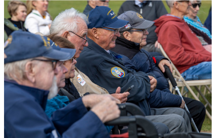
A ceremony at Damage Control Training Facility Kootenay to mark the tragedy was followed by an informal gathering at the Bonaventure Anchor Memorial in Point Pleasant Park

Following a ceremony and wreath laying at DCTF Kootenay , an additional gathering was held at the Bonaventure Anchor Memorial in Point Pleasant Park, which serves as a memorial to RCN members who died serving the Navy during peacetime.