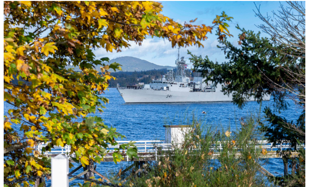
HMCS Ottawa departed from CFB Esquimalt on October 16 to begin a deployment to the Indo-Pacific region under Operations Horizon and Neon.

As part of Canada's Indo-Pacific Strategy, the Royal Canadian Navy says it is committed to working alongside regional allies and partners to promote a stable, secure, and prosperous Indo-Pacific. HMCS Ottawa is also joining another Pacific Fleet ship in the region, as HMCS Vancouver began its own Op Horizon/Neon deployment this past June.