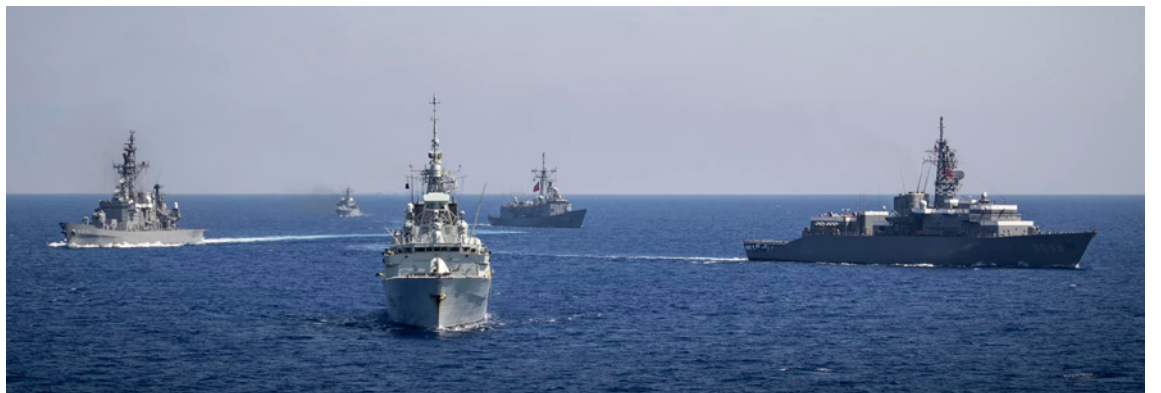
Le SNMG2 et le SNMCMG2 ont récemment effectué un exercice de passage avec des navires de l'escadron d'entraînement de la force maritime d'autodéfense japonaise en Méditerranée de l'Est.