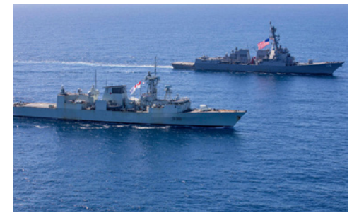
US NAVY / MARINE AMÉRICAINE