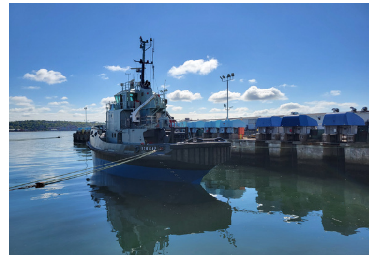
Le soutien de l'IMFCS a été déterminant pour la remise en service du remorqueur vieillissant.

L'achèvement réussi de la révision du Glenevis met en évidence la capacité de