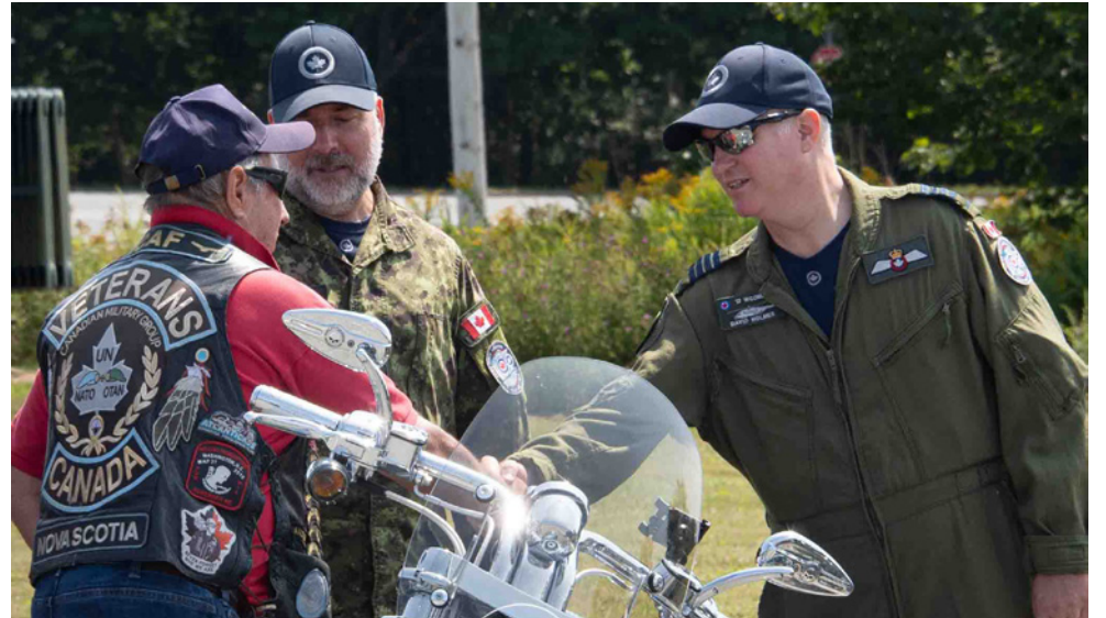
The now-annual event was held for the seventh time this year, with Veterans, serving CAF members and others taking part in a tribute ride from 12 Wing Shearwater to Truro. According to organizers, the ride's purpose is to create a show of respect for both fallen military members and those who are still with us.

MCPL STÉPHANIE LABOSSIÈRE / LA CPLC STÉPHANIE LABOSSIÈRE