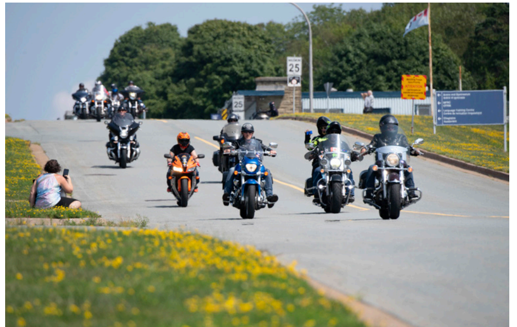
Vehicles of all types were invited to take part in this year's procession, with motorcycles leading the way.