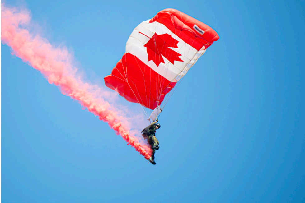
Hundreds were on hand for the Highway of Heroes kickoff event at 12 Wing Shearwater on August 17, including the Canadian Forces Snowbirds, who put on an exciting aerial show for the crowd to start the day.

Des centaines de personnes étaient présentes pour le coup d'envoi de l'« Highway of Heroes » à la 12e Escadre Shearwater le 17 août, y compris les Snowbirds des Forces canadiennes, qui ont présenté un spectacle aérien passionnant à la foule pour commencer la journée.