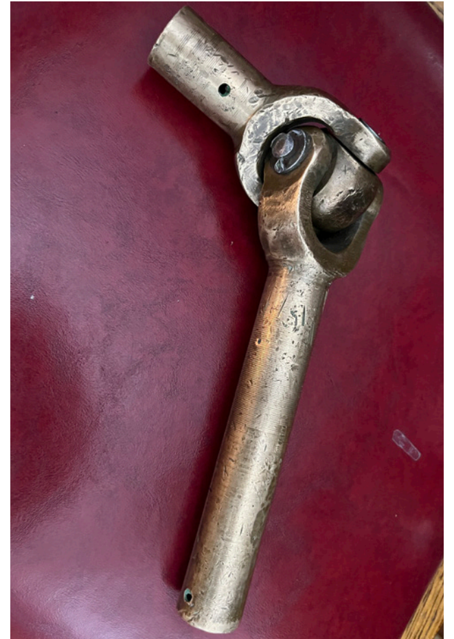
A close-up of the brass joint from HMCS Assiniboine .

On November 10, 1945, while travelling to Baltimore for disassembly, Assiniboine broke its tow during a storm and became wrecked on the shore near