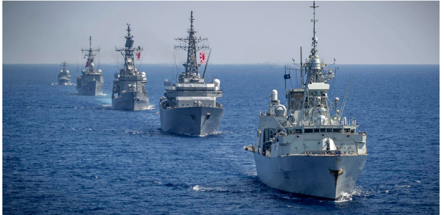
SNMG2 flagship HMCS Charlottetown , along with TCG Gaziantep , and Standing SNMCMG2 flagship ROS Vice Admiral Constantin Balescu, conduct a Passing Exercise with the Japan Maritime Self-Defense Force's Training Squadron JS Kashima and JS Shimakaze in the Eastern Mediterranean.

SNMG2 is a multinational, integrated maritime force made up of vessels from Allied nations to perform vari-