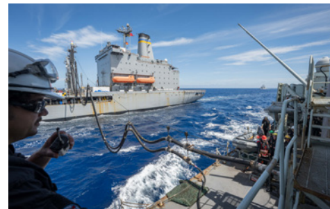
S1 / LE MAT 1 BRYAN UNDERWOOD

Le Navire canadien de Sa Majesté (NCSM) Montréal est vu en train d'effectuer un ravitaillement en mer aux côtés de l'USNS Rappahannock dans l'Indo-Pacifique, alors que le navire poursuit son déploiement dans le cadre de l'opération Horizon. Le Montréal a également navigué récemment avec des partenaires américains du destroyer USS Ralph Johnson – les deux navires ont mené des opérations bilatérales dans la mer de Chine orientale, démontrant la coopération entre les pays tout en renforçant la sécurité maritime. Le NCSM Montréal a quitté Halifax en avril pour une mission de six mois dans l'Indo-Pacifique.