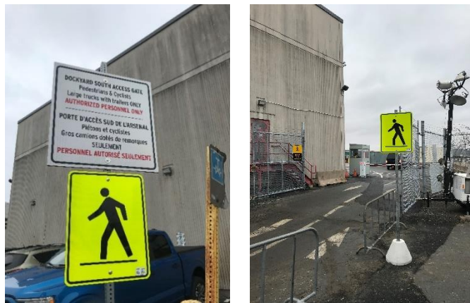
Figure 2. La porte d'accès sud de l'arsenal est ouverte depuis le 6 février 2023, entre le NCSM Scotian et le bâtiment des Services logistiques de la base – matières dangereuses. Cette entrée est réservée aux piétons, aux cyclistes et aux gros camions commerciaux et restera ouverte pendant toute la durée de la fermeture de l'entrée sud de Valour Way.