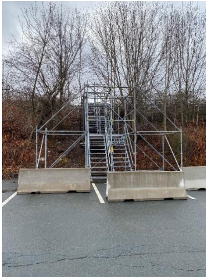
Figure 3. Afin de favoriser des déplacements en toute sécurité pour les piétons entre la rue Barrington et l'arsenal CSM pendant la fermeture de l'entrée sud de Valour Way, des escaliers temporaires ont été construits entre la zone de stationnement K non opérationnelle de l'arsenal CSM/MDN et le couloir de verdure Barrington.

Le MDN construira un escalier permanent à ce même endroit à l'avenir (date de construction à confirmer). Pendant la construction de l'escalier permanent, le public n'aura pas accès à cette zone.