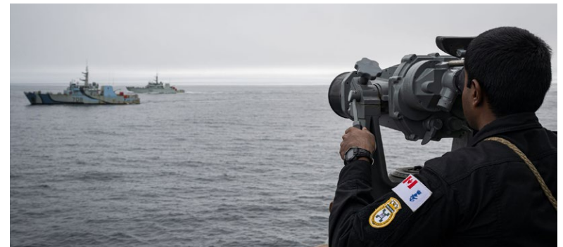
Le NCSM Charlottetown a effectué des manœuvres d'officier de quart avec le NCSM Glance Bay et le NCSM Moncton au cours de l'exercice Cutlass Fury , qui a débuté immédiatement après la Semaine internationale de la Flotte de Halifax.

tous les Canadiens se tournent vers l'avenir. Nous savons que nous devons continuer à faire d'importants investissements dans la Marine royale canadienne en raison du travail important qu'elle accomplit pour nous tous », a-t-il déclaré.