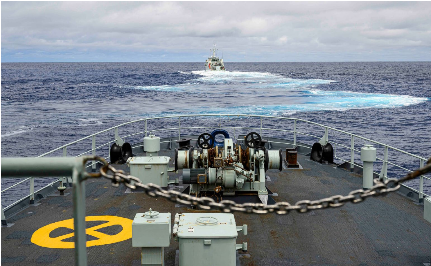
Le NCSM Summerside et le NCSM Shawinigan ont tous deux participé à l'exercice Sandy Coast 2023.