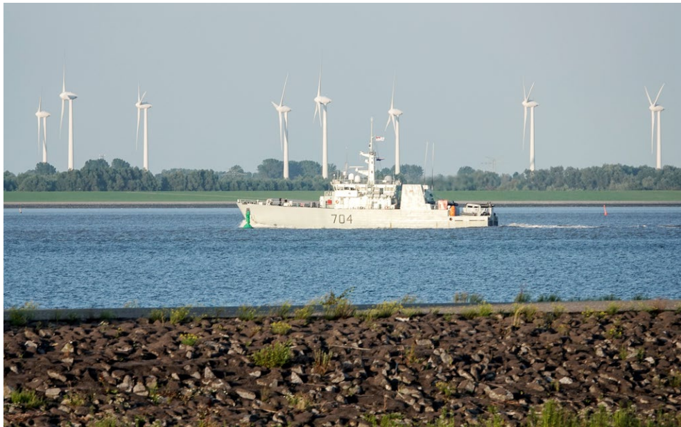
HMCS Shawinigan is seen departing from the port of Delfzijl in the Netherlands to begin Exercise Sandy Coast on August 22. The exercise wrapped up on September 1.

Le NCSM Shawinigan quitte le port de Delfzijl, aux Pays-Bas, pour entamer l'exercice Sandy Coast, le 22 août. L'exercice s'est terminé le 1er septembre.