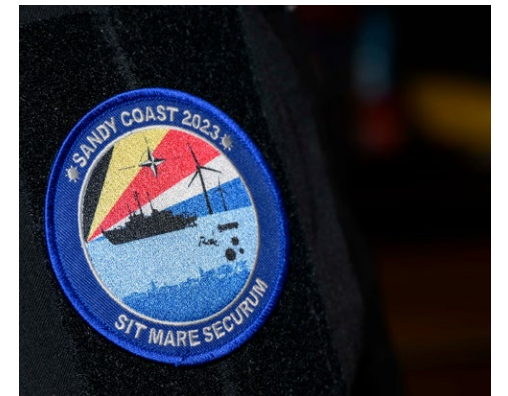
The mission patch for Exercise Sandy Coast 2023.

Standing NATO Mine Countermeasures Group One is a multinational naval task force dedicated to ensuring the safety of maritime navigation by providing a constant and credible MCM capability to the Alliance. The group currently operates in the Baltic Sea, North Sea, and the eastern part of the Atlantic Ocean.