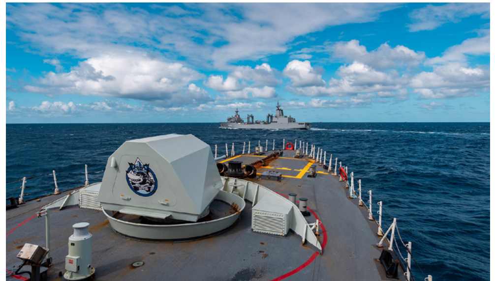
HMCS Montréal sails behind His Majesty's Australian Ship Stalwart in preparation for a liquid replenishment at sea as part of exercise Talisman Sabre while deployed on Operation Projection on July 31.