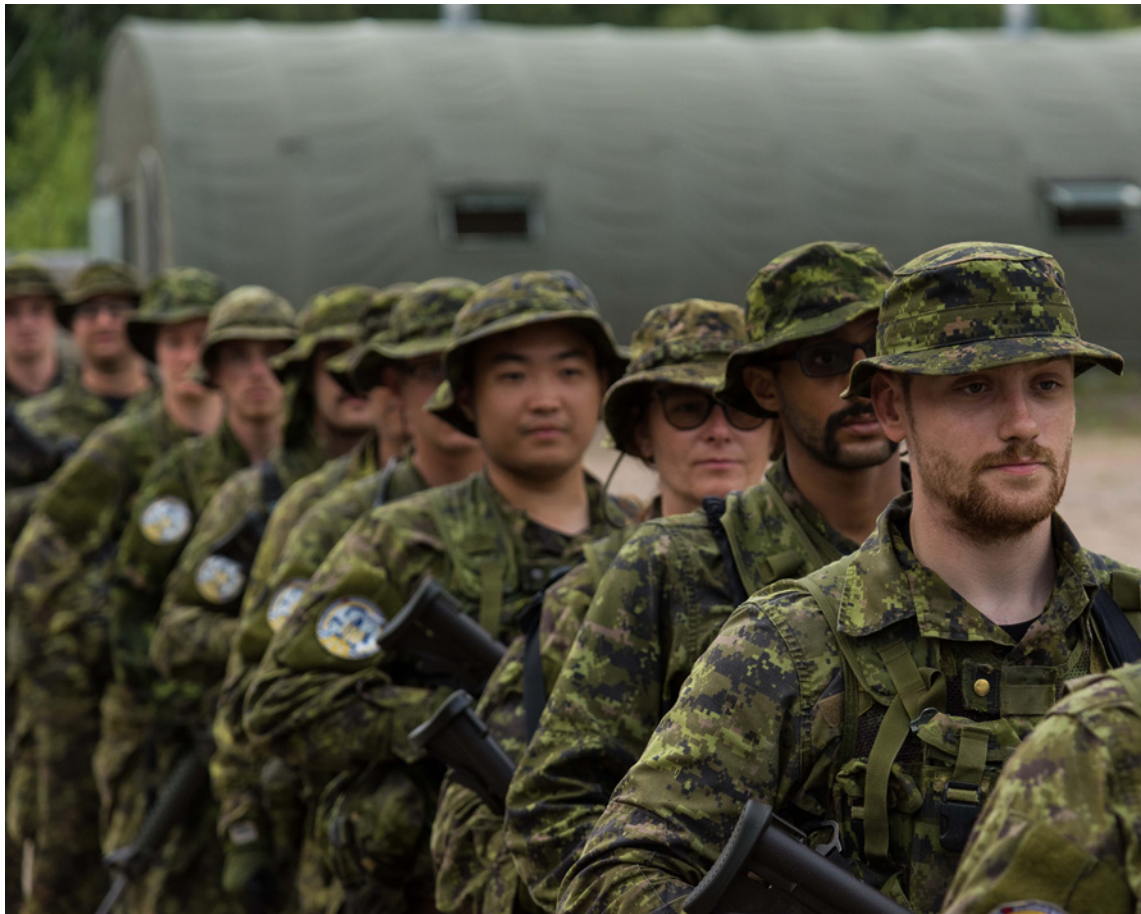
Candidates are seen conducting infantry section manoeuvres during the MOD3 component of the course.

A healthy and sustainable naval force is the product of vibrant and professional recruiting and training efforts. The work by staff at NFS(Q) is helping ensure the next generation of RCN sailors and officers is available to offset the effects of attrition. For Naval Reserves from coast to coast, a crucial wellspring of maritime force generation is found a short drive from Quebec City – at a Canadian Army training site!