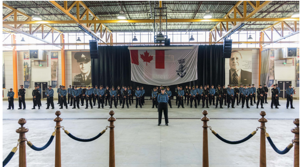
BMQ students conduct a graduation parade at CFB Valcartier on August 23.

And that brings us back to the initial premise of the adage regarding “time and tide”. For the Naval Reserve, summer is the season for Basic Training. Since the majority of recruits are either