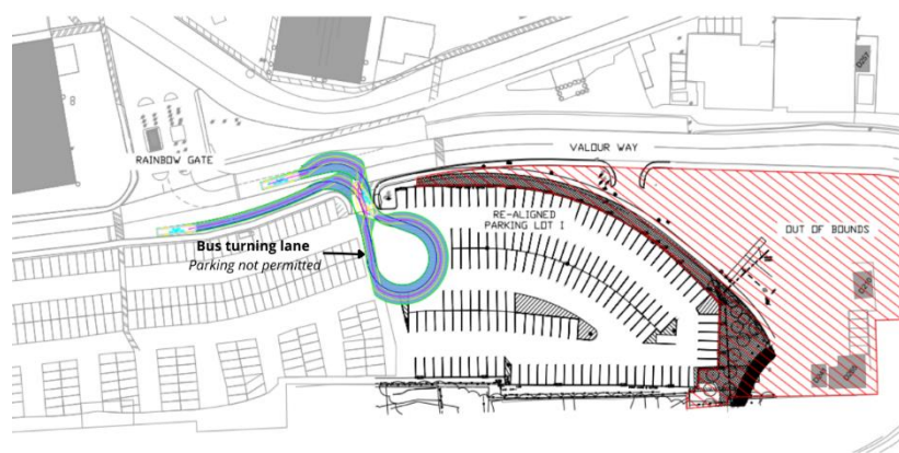
Figure 1 : La zone de stationnement I nouvellement réaménagée a été rouverte aux membres de l'Équipe de la Défense le 25 juillet. Une voie de virage (en bleu) de la ligne d'autobus 11 d'Halifax Transit (arsenal) a été prévue dans la conception de la nouvelle aire de stationnement. Voir la mise à jour sur « les incidences sur les arrêts d'autobus et les itinéraires d'Halifax Transit » ci-dessous pour obtenir plus de renseignements.